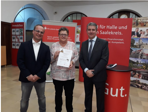
Checkübergabe in der Sparkassenfiliale Rathausstraße

Für die dringend notwendigen Sanierungs- und Renovierungsmaßnahmen in unserem Bürgerhaus haben wir aus Mitteln der PS-Lotterie eine Spende in Höhe von 2.500 Euro erhalten. Die können wir sehr gut verwenden, zum Beispiel für die Erneuerung der Fußboden- und Wandfliesen in unserer Küche.