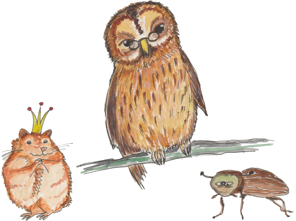
Illustration: Antje Brödner-Höhle